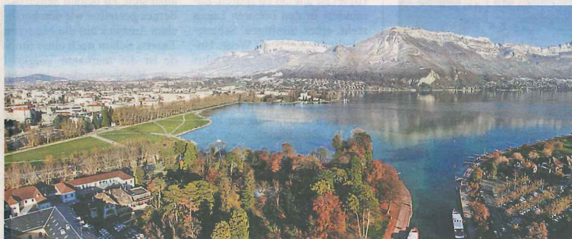
Der Lac d'Annecy gilt als einer der saubersten Seen der Welt