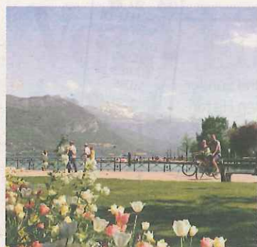
Die „Gärten Europas“ zwischen den Quais Jules Philippe und Napoléon III