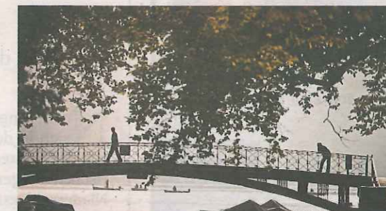
Romantisch. Die gusseiserne Brücke „Pont des Amours“