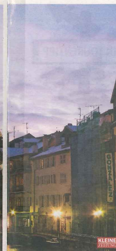
Angezuckert. Notre-Dame-de-Liesse im Stadtzentrum

Mit dem Blick über den See und die Berge gelingt das sicher auf jeden Fall.