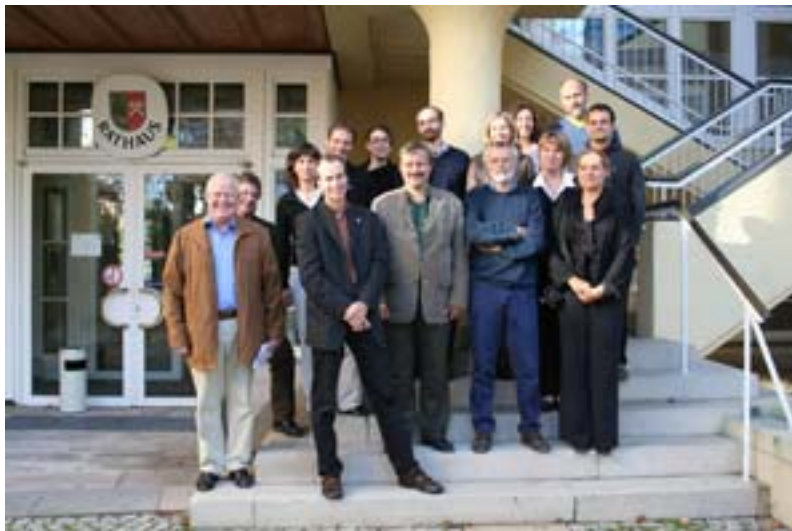
Potencialni projektni partnerji so se srečali na delavnici v Kemptnu/Sonthofnu.