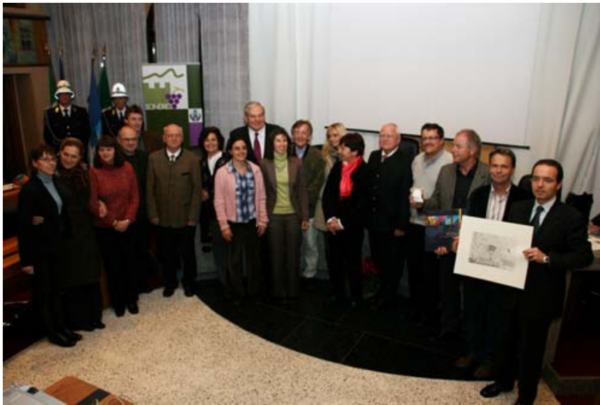
Skupinska fotografija predstavnikov in predstavnic društva Alpsko mesto leta, Sondrio, 30. 11. 2007

V letu 2007 je društvo Alpsko mesto leta praznovalo desetletnico svojega obstoja. Ob zaključni slovesnosti v Sondriu so si alpska mesta izmenjala simbolična darila in tako proslavila ta pomemben dogodek. Sekretariat je ob tej priložnosti izdal novo informativno brošuro, v kateri so poleg petih ciljev društva na kratko predstavljena tudi mesta, ki jim je bil doslej podeljen naziv alpskega mesta leta. Brošura je objavljena tudi na internetu, v tiskani in elektronski obliki pa je bila poslana vsem alpskim mestom leta, članom žirije in Stalnemu sekretariatu Alpske konvencije. Sekretariat je poleg tega vzpostavil stik s podjetjem, ki namerava posneti dokumentarni film o alpskih mestih leta. Da bi slavnostno praznovanje nekoliko bolj približali javnosti, je bilo v štirih jezikih objavljeno tudi posebno sporočilo za medije in razposlano na 2500 naslovov medijev.