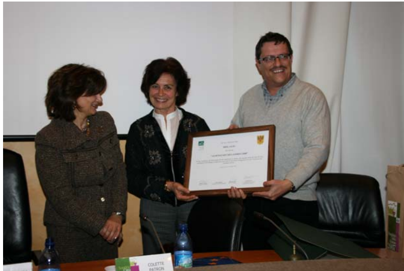
Predaja naziva mestu Brig-Glis, Sondrio, 30. 11. 2007