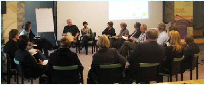
Dialogue ville – campagne à Bad Reichenhall/D .

Pour l'association Ville des Alpes de l'Année, 2009 aura été l'année du dialogue. La relation entre ville et campagne a été le thème du séminaire international organisé en collaboration et en concertation avec le Réseau de communes « Alliance dans les Alpes » et le Secrétariat permanent de la Convention alpine les 16 et