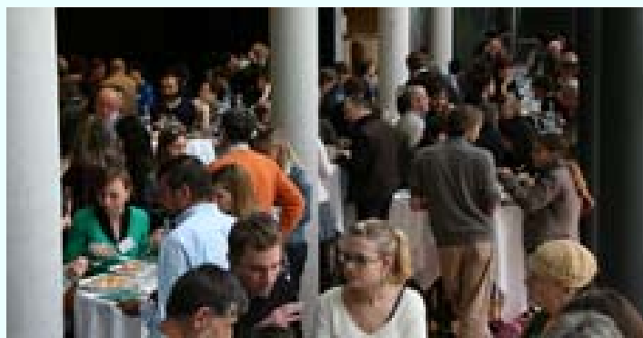
Environ 200 personnes ont participé à l'échange de savoirs organisé dans le cadre de la conférence internationale « Sang froid sous l'effet de serre ! ».

La ville de Bolzano a achevé son année en tant que Ville des Alpes avec l'adoption par le conseil municipal du pacte climatique de Bolzano : « Source d'énergie. Emissions de CO 2 et scénarii possibles de réduction pour la ville de Bolzano ». L'Académie européenne (EURAC) a soutenu les efforts de la ville qui entreprendra dans les prochains mois les mesures nécessaires pour atteindre la neutralité climatique d'ici 2030.